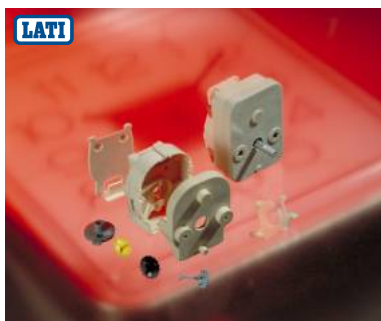
LATAMID 66 H2 G/25-V0CT1 Temporizzatore / Timer contaminuti (per piccoli elettrodomestici)