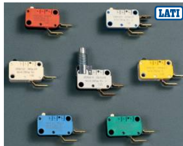
LATAMID 66 H2 G/25-V0CT1 Micro-interruttori