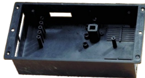
LATI Parte di un elevatore in LATISHIELD 36/AR-05A-V0