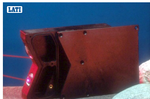
Contenitore di strumento elettronico (utilizzato per misurare lo spessore di componenti ceramici) in LATISHIELD 87/28-07A G/20

Nota: se ha interesse a ricevere altre informazioni si prega prendere contatto con i nostri Uffici